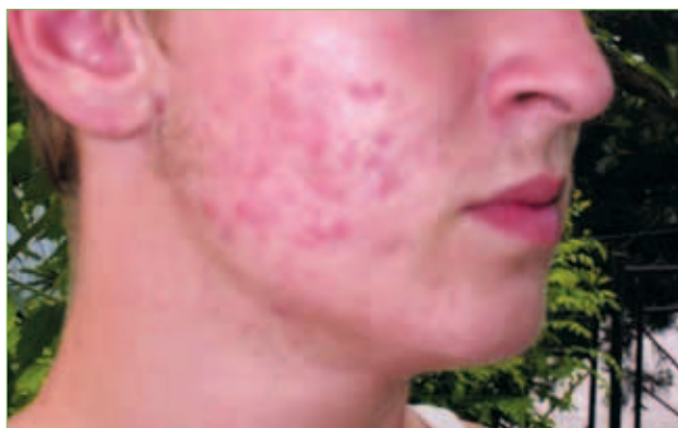
Po aplikaci Biostimulu

Stav středně těžkého akné v obličeji, vřídky jsou výrazně zanícené a pokrývají velkou část obličeje.